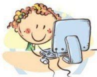
2. ПОЛОЖЕНИЕ МОНИТОРА