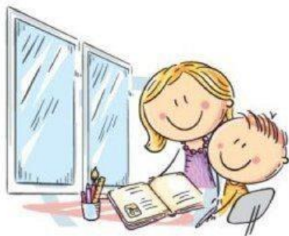
1. ЕСТЕСТВЕННОЕ ОСВЕЩЕНИЕ

ЕДИНЬЙ КОНСУЛЬТАЦИОННЫЙ ЦЕНТР РОСПОТРЕБНАДЗОРА 8-800-555-49-43