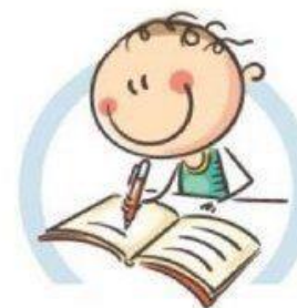
4. СИДИТЕ ПРАВИЛЬНО