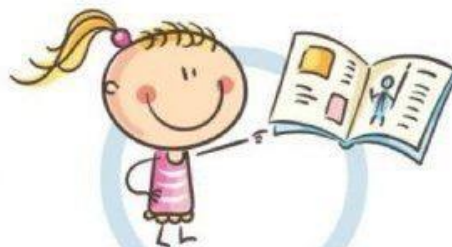
3. РАССТОЯНИЕ ДО КНИГ