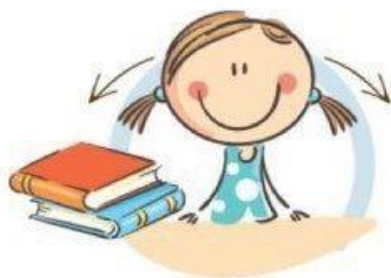
1. ФИЗКУЛЬТМИНУТКА ДЛЯ УЛУЧШЕНИЯ МОЗГОВОГО КРОВООБРАЩЕНИЯ