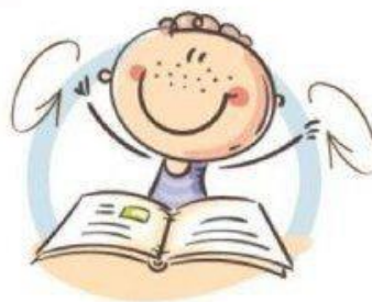
2. ФИЗКУЛЬТМИНУТКА ДЛЯ СНЯТИЯ УТОМЛЕНИЯ С ПЛЕЧЕВОГО ПОЯСА И РУК