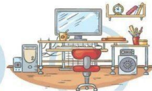
5. СООТВЕТСТВИЕ МЕБЕЛИ