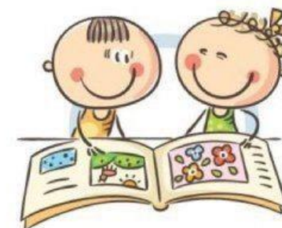
4. УПРАЖНЕНИЯ ГИМНАСТИКИ ГЛАЗ